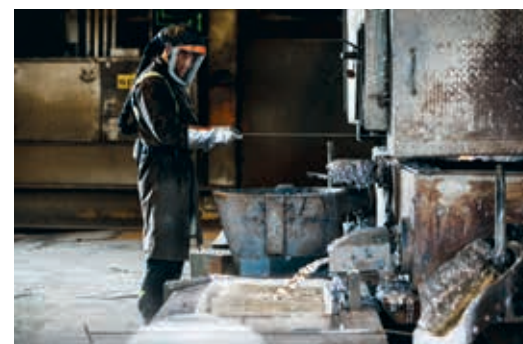
CAMPINE "We zijn een grondstoffenbedrijf. Onze activiteiten zullen altijd cyclisch blijven."